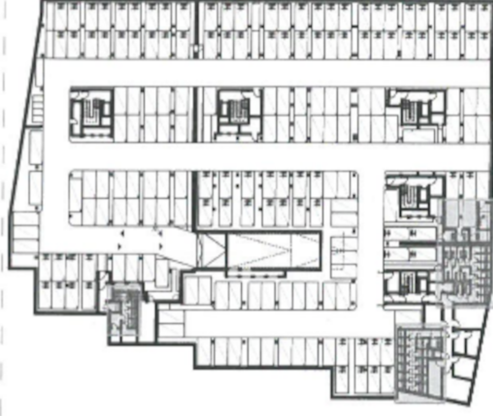
lokalizacja na rzucie